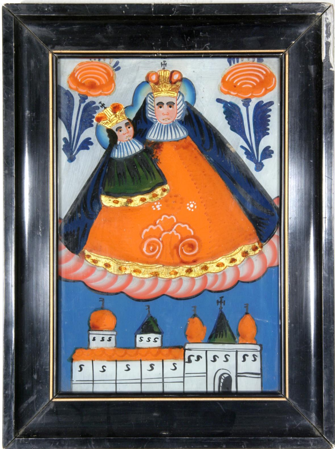
Pohoří na Šumavě Nn 219