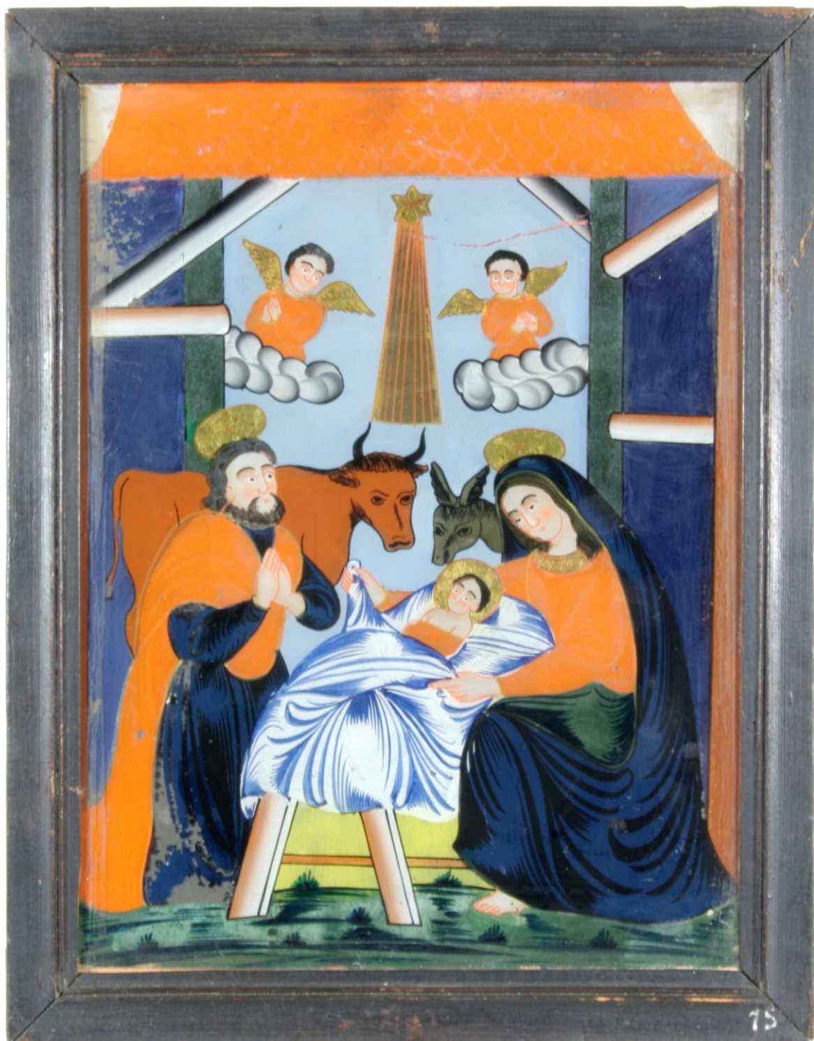
Pohoří na Šumavě Nn 165