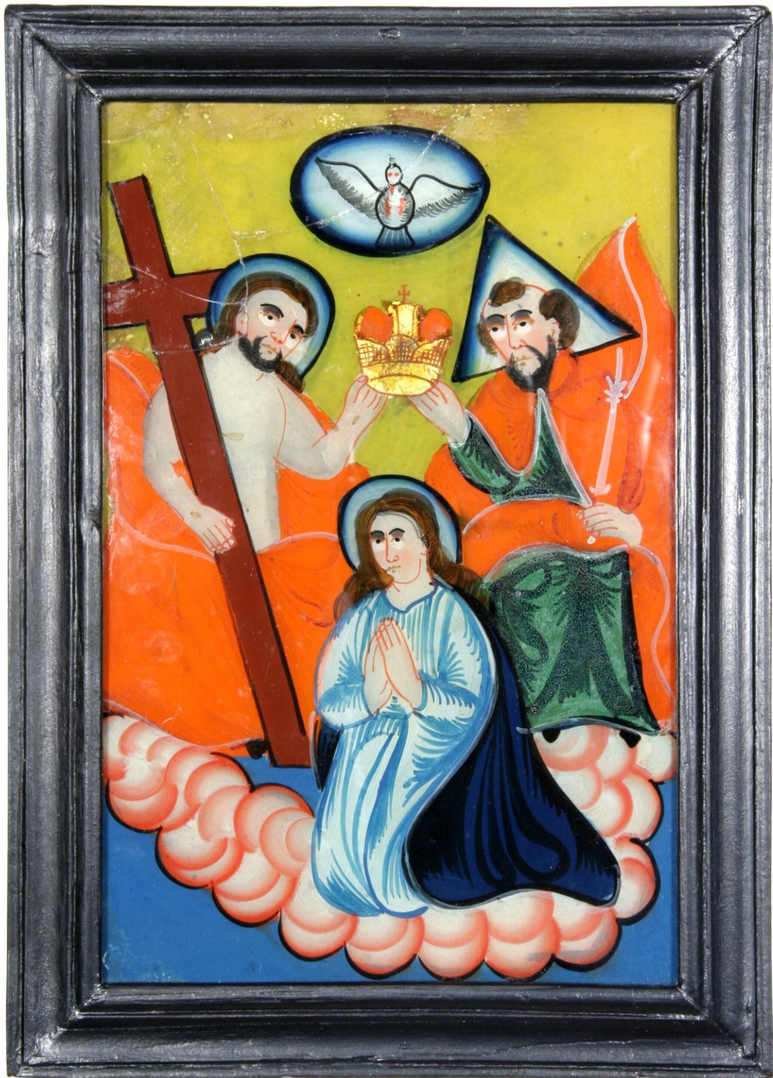
Pohoří na Šumavě Nn 203